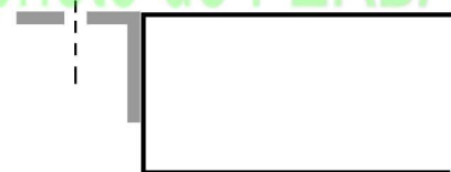
Sans perçage avec équerres de fixation