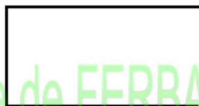
Sans perçage ( à souder )